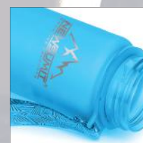
Cinta útil para transportar