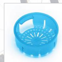
Filtro regulador salida agua