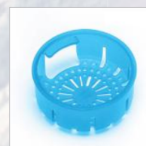
Filtro regulador salida agua