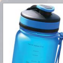
Medidas den Oz y ML