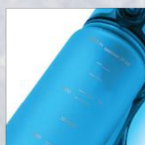
Medidas den Oz y ML