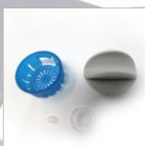
Bola Shaker y repuesto de silicona