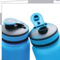
A prueba de derrames