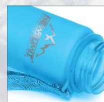
Cinta útil para transportar