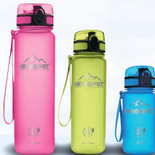
1.000 ml 500 ml 350 ml

Recomendado para uso en todos los deportes como también en el hogar y oficina.