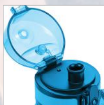
A prueba de derrames